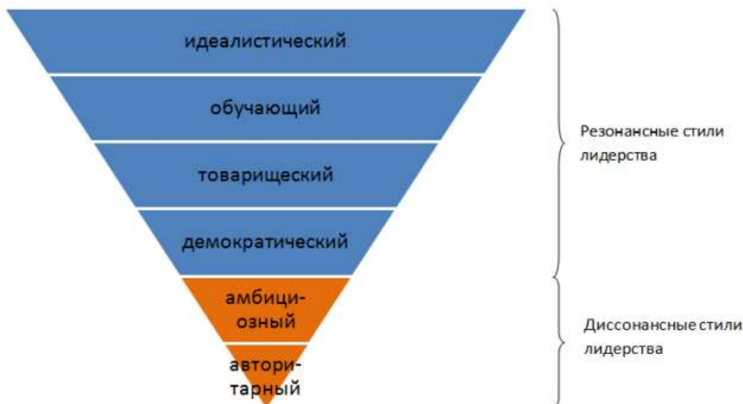
Рис. 3. Стили лидерства

...эффективные лидеры используют один или несколько стилей лидерства и искусно переключаются с одного на другой в зависимости от ситуации. Четыре из шести известных стилей лидерства – идеалистический, обучающий, товарищеский и демократический – способны зажечь, воодушевить людей, что приводит к повышению производительности, тогда как два остальных – амбициозный и авторитарный – хотя порой и нужны, но должны применяться с великой осторожностью (рис 3).