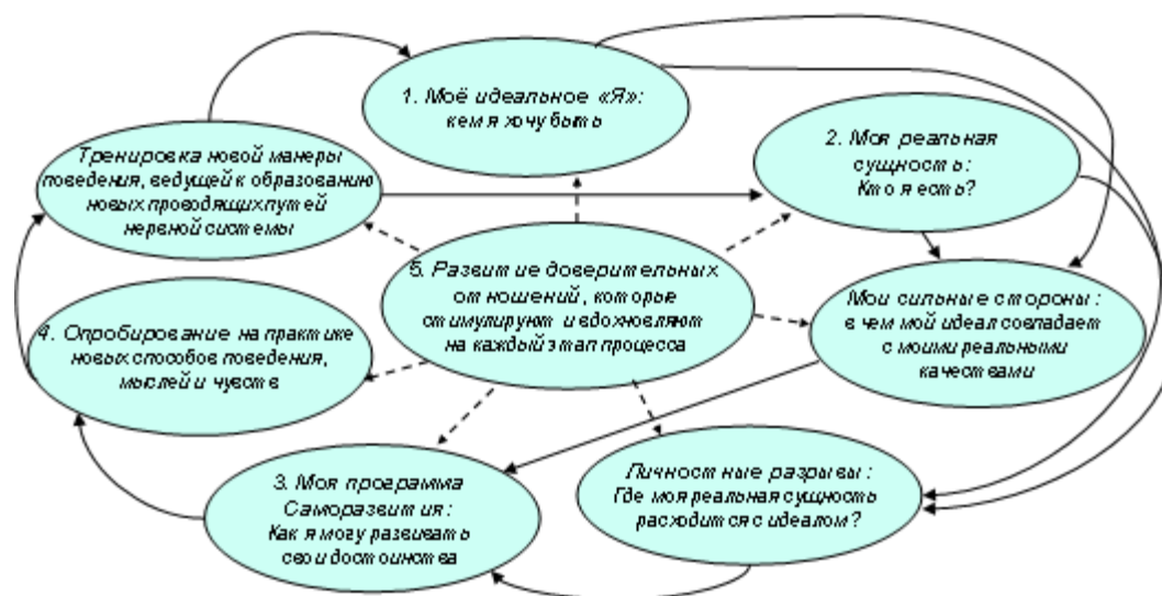
Рис. 4. Теория Бояциса о самоуправляемом обучении

Основу развития лидерских способностей составляет самоуправляемое обучение (рис. 4) – целенаправленное развитие какого-то качества той личности, какой вы хотите быть.