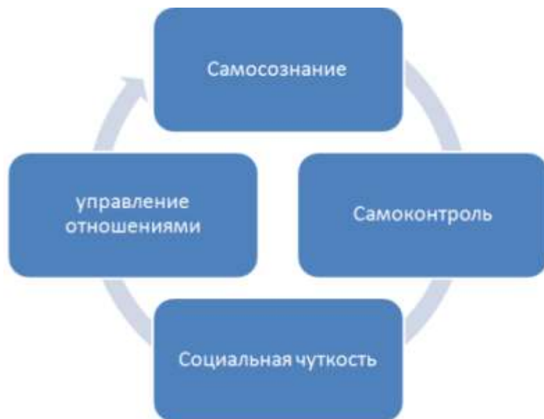
Рис. 2. Модель эмоционального интеллекта

Модель эмоционального интеллекта (рис. 2) позволяет более четко сопоставлять конкретные способности с теми механизмами головного мозга, которые ими управляют. Навыки эмоционального интеллекта не являются врожденными. Лучшими руководителями всегда будут эмоционально интеллектуальные лидеры, умеющие вызвать у людей искренний отклик.